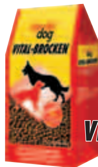
deuka dog VITAL-BROCKEN

deuka dog Welpenkost ist auch für die Zuchthündin geeignet