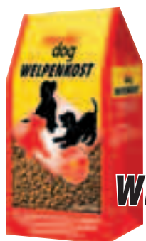
deuka dog WELPENKOST

mit Geflügelfleisch und Geflügelfett* – daher auch so bekömmlich!