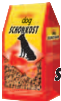
deuka dog SCHONKOST

deuka dog Leistungsbrocken ist besonders lecker und gibt Ihrem Hund den notwendigen Energiekick.