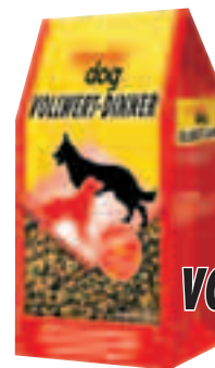
deuka dog VOLLWERT-DINNER

Die optimale Kombination von Nähr- und Ballaststoffen garantiert beste Verdaulichkeit und eine artgerechte, natürliche Versorgung mit allen lebensnotwendigen Mineralstoffen, Spurenelementen und Vitaminen. Die knackigen deuka dog Vital-Brocken fördern vorzüglich die tägliche Gebißpflege.