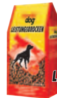
deuka dog LEISTUNGSBROCKEN

So versorgt deuka dog Vollwert-Dinner Ihren Hund mit allen lebensnotwendigen Nährstoffen, um ihn kerngesund und munter zu erhalten.